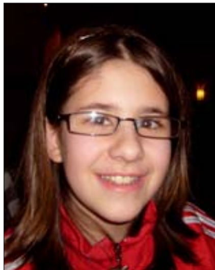
Nina war mit dem richtigen Durchblick unterwegs.