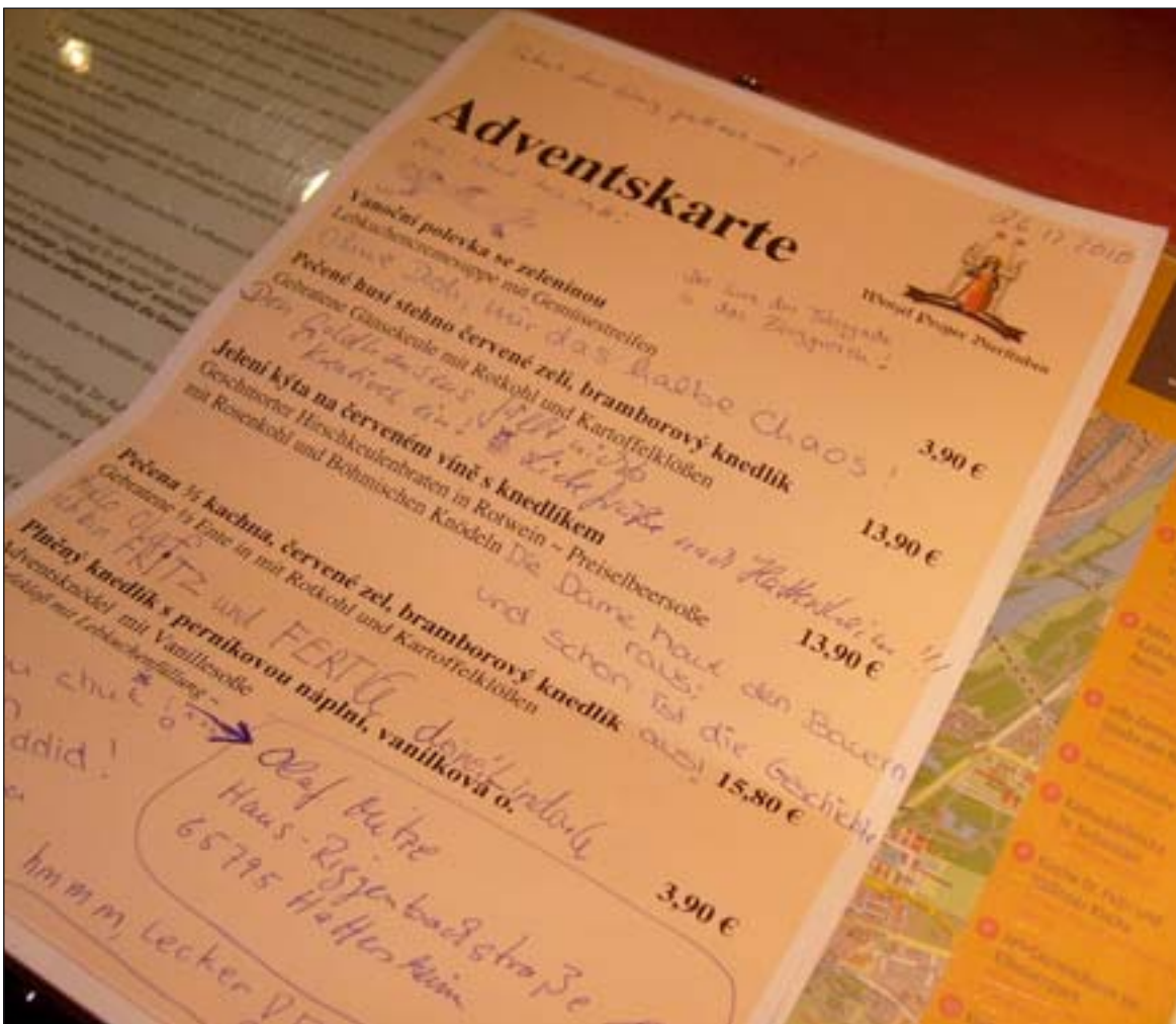
Grüße in die Heimat.